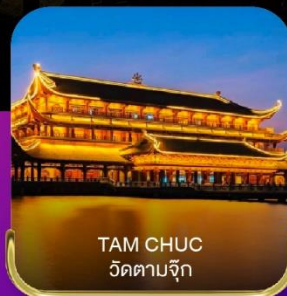
TAM CHUC วัดตามจุก