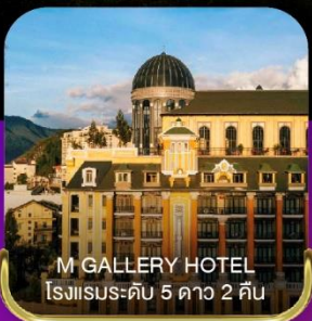
M GALLERY HOTEL โรงแรมระดับ 5 ดาว 2 คืน